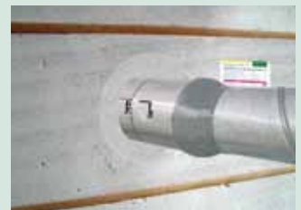
Dicht eventuele ruimte af en plaats de BIS Pacifyre® Universeelkaart