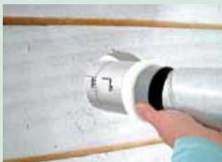
Schuif de spirobuis over de uiteinden