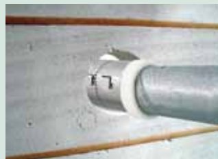
De Pacifyre® MK II Spiro is aangesloten