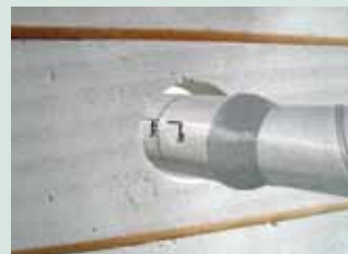
Werk de aansluiting af met tape