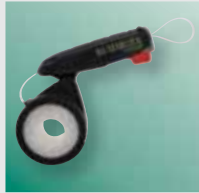
BIS STARLOCK® I

De compact uitgevoerde BIS STARLOCK® I is bij uitstek geschikt voor doe-het-zelf gebruik. De BIS STARLOCK® II is voorzien van een hendel om het kabelband strak te trekken en daarmee uitgerust voor professioneel gebruik.